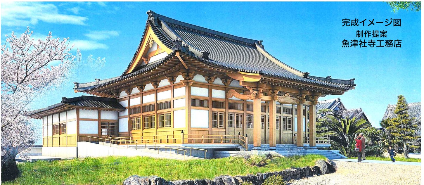
完成イメージ図 制作提案 魚津社寺工務店

和泉町各組長様のご協力により建設委員会が立ち上がり、檀信徒の皆さまの当趣旨へのご理解ご賛同を賜って、本堂再建の話合いが着々と進んでおります。あらためてここに感謝申し上げます。業者が決まったことから、今後事業の進捗に合わせた最新情報をお知らせすべく広報誌をお届けします。加えまして、いよいよご懇志のお願いが始まります。厳しい経済状況とは存じますが、ご理解ご協力のほどを謹んでお願い申し上げます。