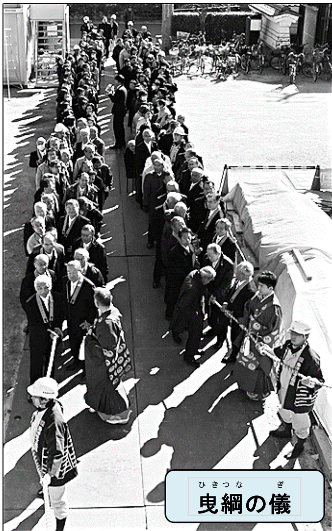
ひきつなぎ 曳綱の儀