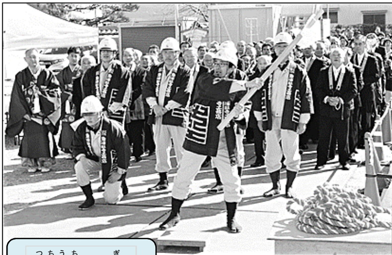
つちうちぎ 槌打の儀